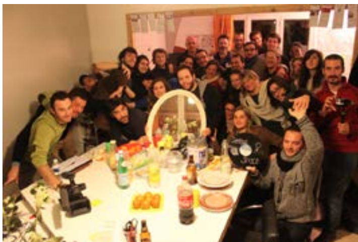
PHOTO: MASTERCLASS MOBILAB SONGO & MASTERCLASS VOCABULAIRE DES TIERS-LIEUX À LA MYNE/ OPENCITYLAB/ PAR AURÉLIEN MARTY_CC BY-NY-SA