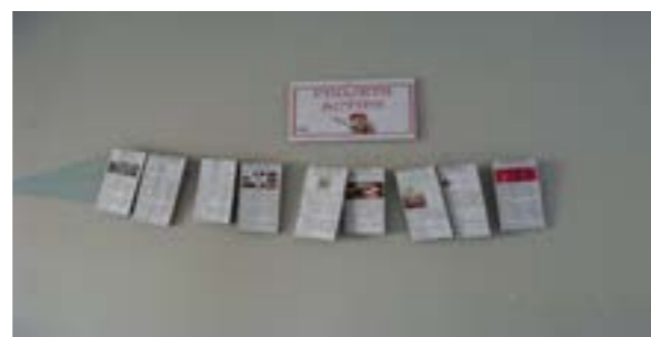
PHOTO: LES PROJETS ACTIFS DE LA MYNE PAR NATHALIE FELTMANN_CC BY-NC-SA

U Un nouveau projet de matériaux naturels, la mise en place d'une collaboration avec l'association Zone-AH! (ZEBU), un changement de porteur de projet pour OpenMicroMetha, un rocket stove efficace, toujours des projets "énergie" mais de plus en plus de bio pour 2017 !