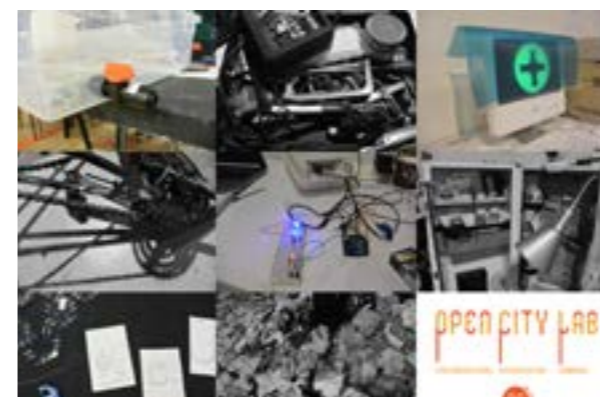
PHOTO: LES OEUVRES DE L'OPEN CITY LAB PAR BABOO_CC BY-SA LOGO: CLEMENT_CC BY-NC-SA

LA MYNE EST CO-COMMISSAIRE DE LA BIENNALE DU DESIGN 2017 AVEC L'OPEN FACTORY ET LA MAISON JULES VERNES