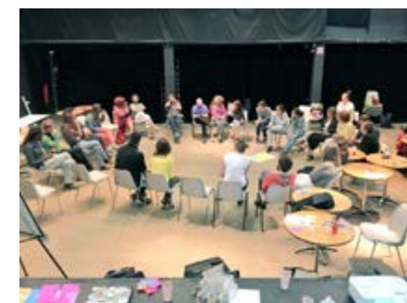
RÉUNION FIC AU CCO

LA MYNE, LE CCO ET LE CENTRE SOCIAL PORTENT LE LABEL FABRIQUE D'INITIATIVES CITOYENNES DEPUIS 2016